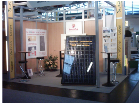
1. Vorstellung: SolarPur DuoKollektor auf der H+H 2007