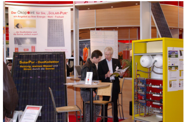
Auf der IHM 2008 stellten wir den DuoKollektor und den „ Dummy „ von 2006 des THERMOGENERATORS als Funktionsbeispiel vor.